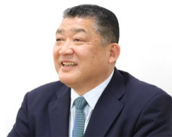
鳥取学園 理事長 兼 鳥取城北高等学校 校長